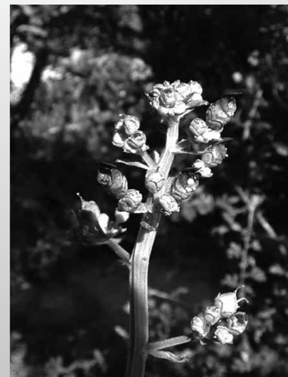
Geoord Helmkruid.